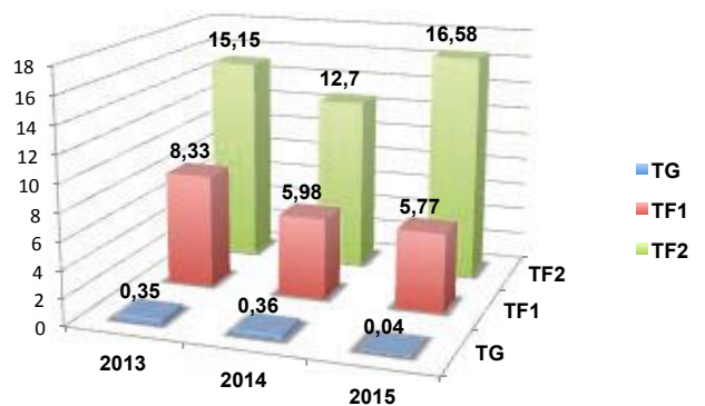
TF1, TF2 et TG pour le collège travaux, comparaison sur la période 2013-2015